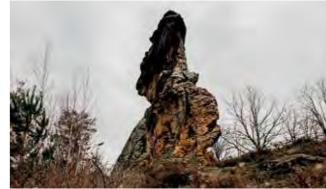
In der Rubrik Cache 'n' Camp sind Nadine und Rikkert von "freeda reist" im Harz unterwegs.