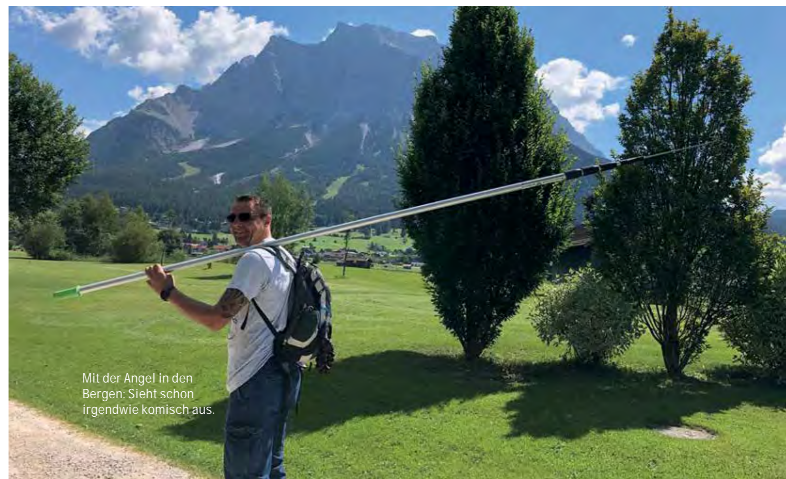
Mit der Angel in den Bergen: Sieht schon irgendwie komisch aus.

Aus dem Besserverstecker wird dann der Höherverstecker. Auch nicht besser. Aber jetzt: Viel Spaß da draußen und droben wünscht Michael Grupp.