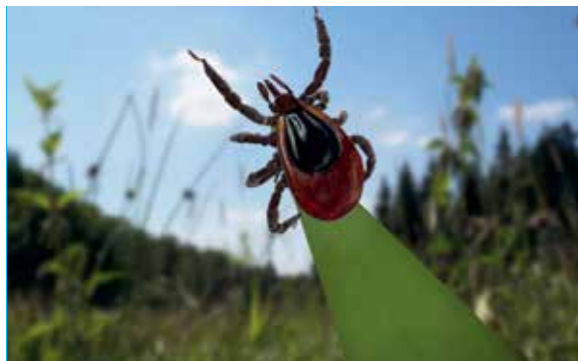
Alles über Zecken steht in dem Bericht in dieser Ausgabe. Wie schützt man sich und was ist bei einem Stich.