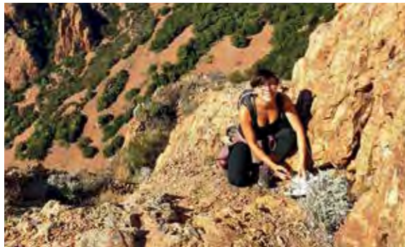
biotonne88 went Europe – was sie auf ihrer Geocaching-Tour erlebt hat, lest ihr hier.