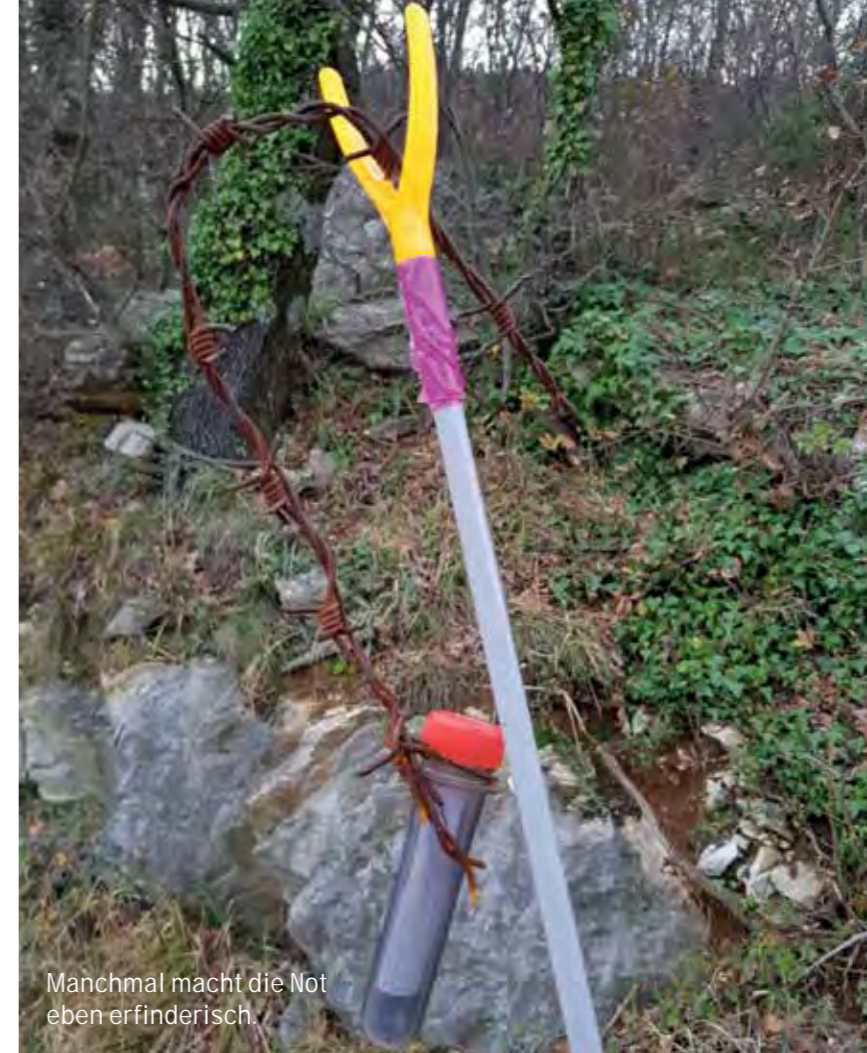
Manchmal macht die Not eben erfinderisch.

Aus der Praxis für die Praxis: Am Sonntag machen Angelcaches keinen Spaß – dafür ist das Equipment einfach zu auffällig. Achtet peinlich genau darauf, dass die Mastsegmente beim Ausfahren auch wirklich fest miteinander verbunden sind – sonst kommen die Euch wieder ungewollt entgegen. Und auch wenn ihr eine zwölf Meterrute habt, hängt die Dose wieder an den Ast, wo sie war. Originalzi-