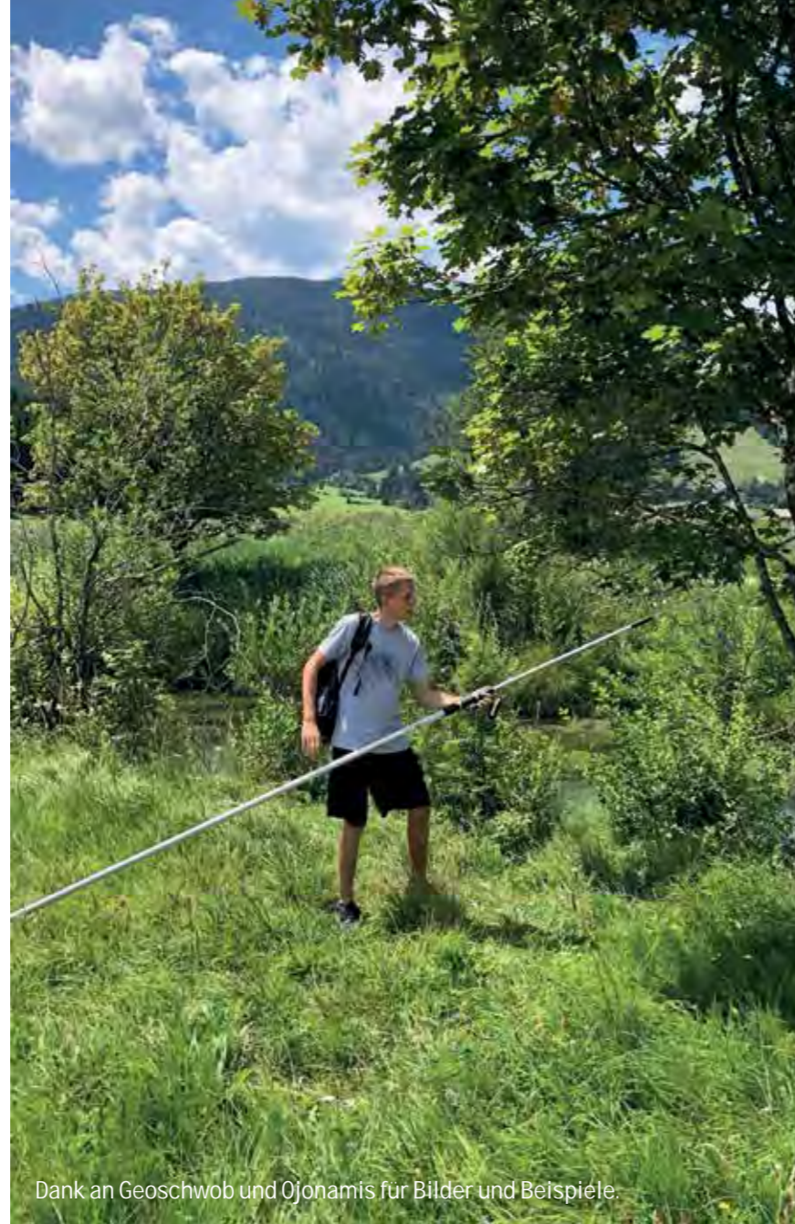
Dank an Geoschwob und Ojonamis für Bilder und Beispiele.

Aber der Reihe beziehungsweise dem Preis nach. Aus dem wohl-sortierten Supermarkt (respektive Amazon) stammt die schnellste und einfachste Methode: eine ausziehbare Verlängerungsstange für Leifheit Fensterreiniger. Kostet circa 25 Euro, ist leidlich stabil, verlängert Euren Arm aber nur um vier Meter. Ein weiterer Nachteil: Eingefahren ist die Stange immer noch 140 Zentimeter lang. Das ist im Wald ziemlich unpraktisch. Andere Anbieter winken mit Stangen bis zu zwölf Metern – das Grundproblem mit der Ausgangslänge bleibt. (Der Rekord schafft die Axis Line Profi mit 16 Metern Länge bei einer Grundlänge von über vier Metern). Wen das nicht stört, kann zugreifen. Die Lösung aus