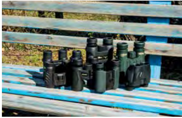
Wir haben uns Ferngläser verschiedener Ausführung angeschaut. Unsere Kaufberatung zeigt das Ergebnis.