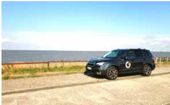
Wie ich bequem im Auto schlafen kann, haben wir ausprobiert und unser Auto zum "Wohnmobil" umgebaut.