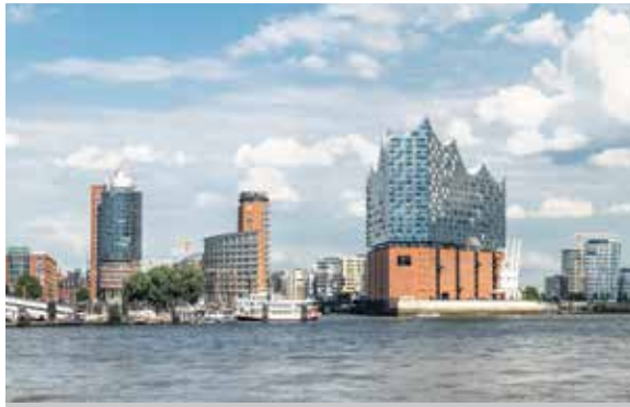
Anfang Mai ist in Hamburg der erste Giga-Event des Jahres. Wir haben uns im Vorfeld dort umgeschaut.