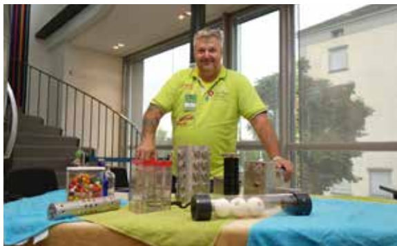
Birre hat ein Faible für trickreiche Travel Bugs. Wir stellen den sympathischen Belgier in dieser Ausgabe vor.